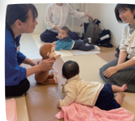
R6年に開催したイベントの様子